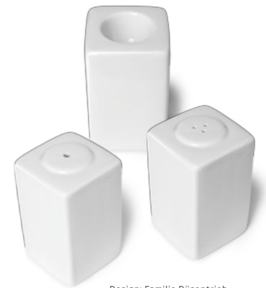
Design: Familie Düsentrieb

War schon der eiPott der »King of Give-Aways« - jeder wollte ihn haben - wie wird es erst seiner neuen Familie gehen? Als Streuartikel ist ihnen eine hohe Auflage gewiss, - wenn sie ihre Aufgabe ernst nehmen, ihren Inhalt sauber ausstreuen und mit ihren großen Werbeflächen Marken und Botschaften unter die Leute bringen. Wir haben da keine Bedenken! Zumal wir auch hier einen hohen Grad an Individualisierung bieten können: alle Veredelungstechniken sind ab 250 Stück anwendbar, von der Hydroglasur über klassischen Druck bis hin zur Gravur.